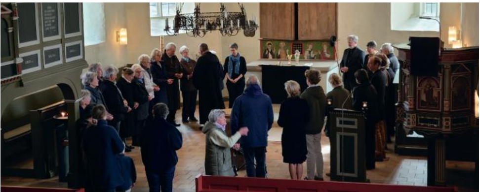
Karfreitag: Abendmahl-Gottesdienst mit eingeklapptem schmucklosen Altar