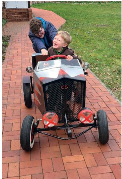
...auch das ist Gartentag!