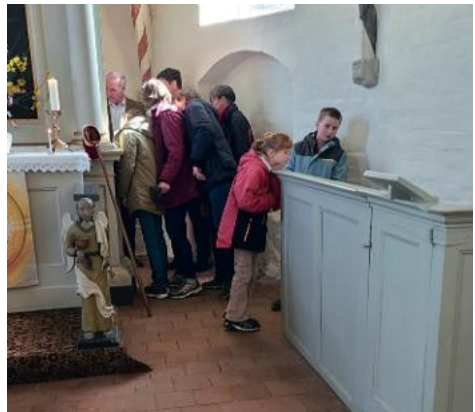
...suchen die dort Ostereier? :-)