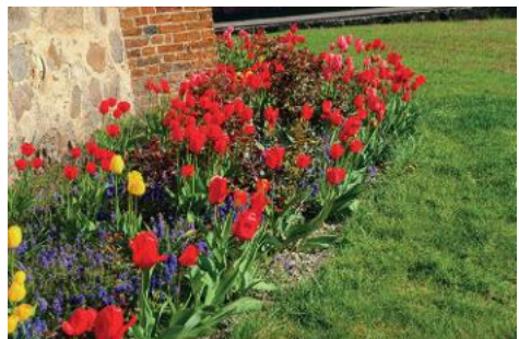
...ein buntes Band um die Kirche