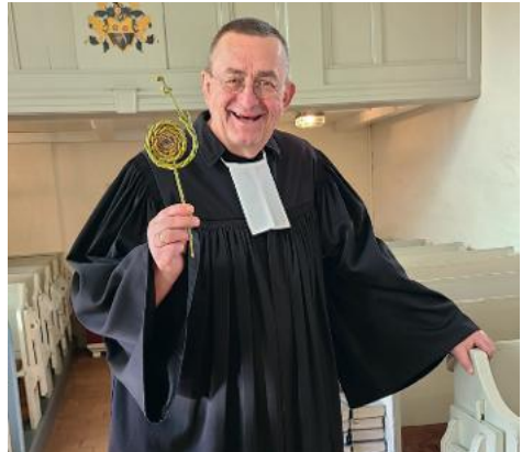
na klar: ...meistens im Talar!