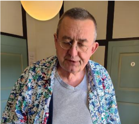
...scheinbar hat er mehr als nur EIN buntes Hemd...