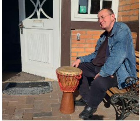
...und im Alltagskostüm auf seinem Lieblingsplatz