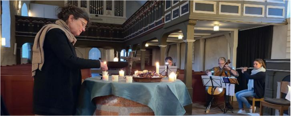
Gründonnerstag: Taizé Gottesdienst mit Agapemahl - Danke dem Team um Elke Meier Knoop