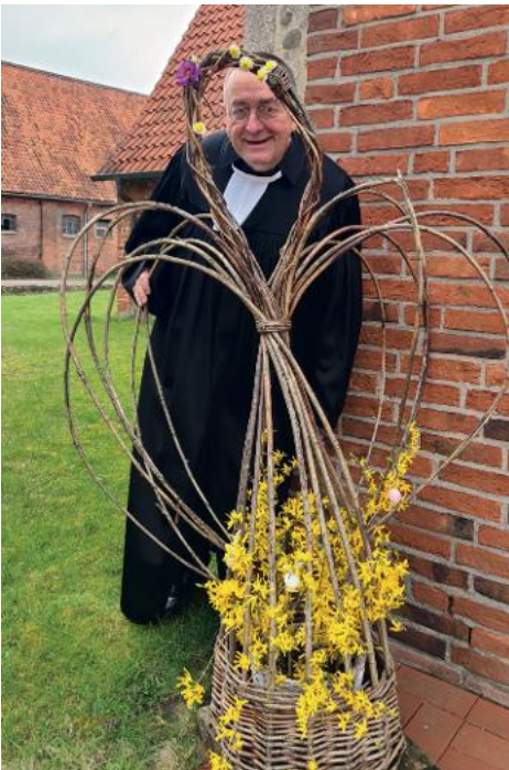
...ein Engel ;-)