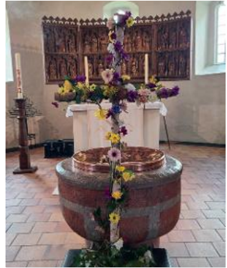
das geschmückte Kreuz