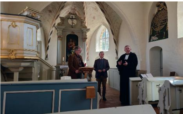
Ostermontag: Festgottesdienst in Hohnhorst